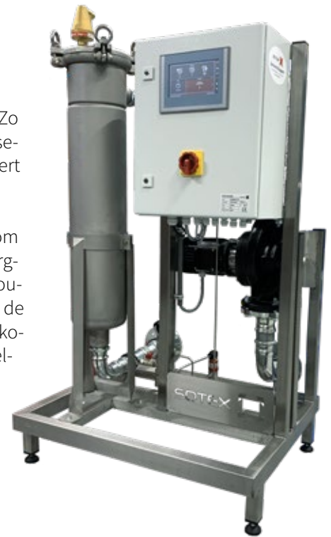
Cleanomat Pro 36

De units zijn gelijk aan de opbouw van de SFU(P)+ serie en worden geleverd in de volgende capaciteiten: 6, 12, 20, 36, 54, 72 en 108 m 3 /uur.